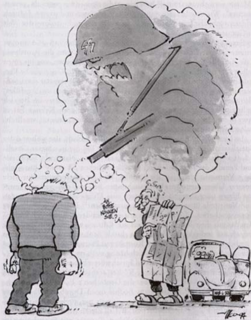
Karikatur: Albo Helm, Dagblad Tubantia , 17. September 1994